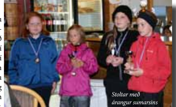
Stoltar með árangur sumarsins